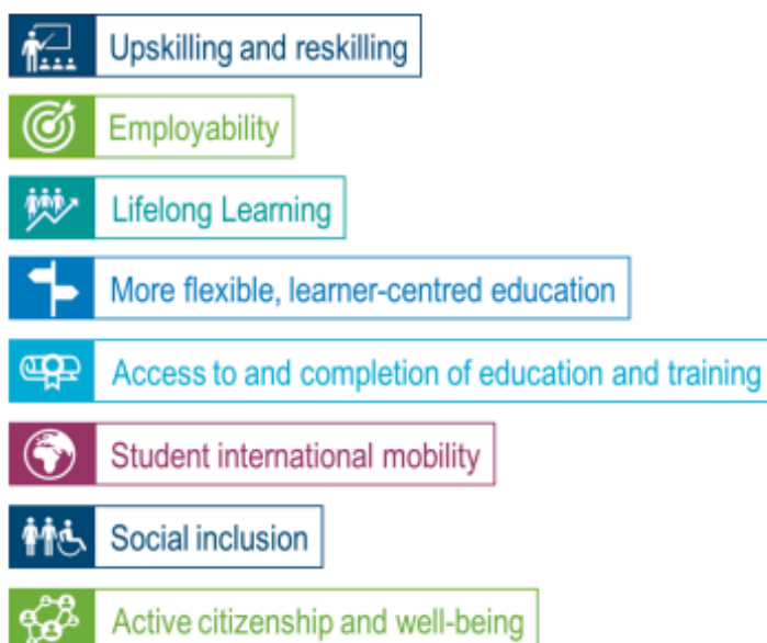
Figure 2. Examples of context in which micro-credentials are expected to play a role

Izvor: Micro-credentials for Lifelong Learning and Employability: Uses and Possibilities, 2023, 66/4 https://www.oecd-ilibrary.org/docserver/9c4b7b68-en.pdf?expires=1709558943&id=id&accname=guest&checksum=D078DEF217964DC8E0756B5441158FCD